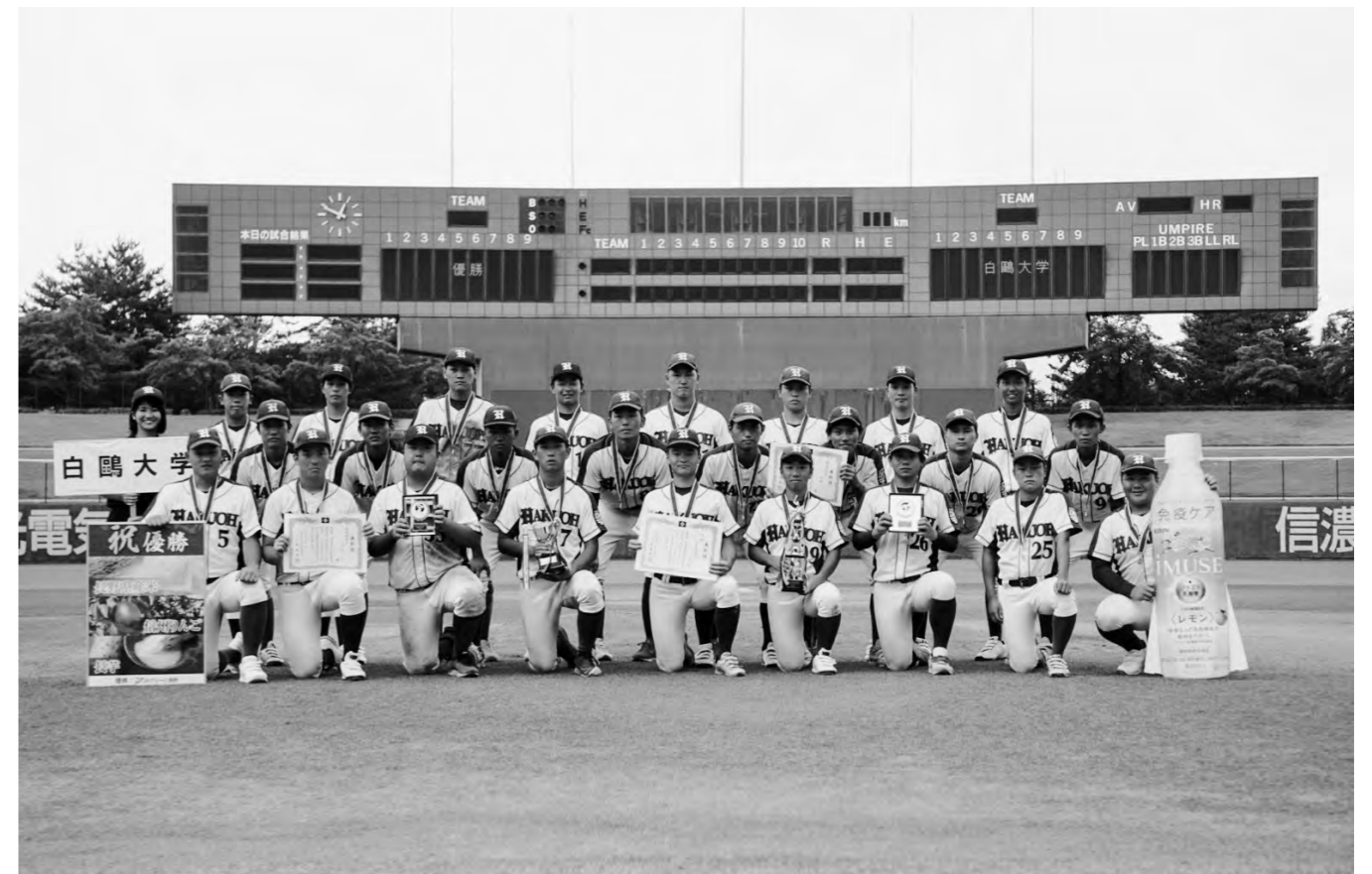
第2回全日本大学軟式野球選抜大会(優勝)