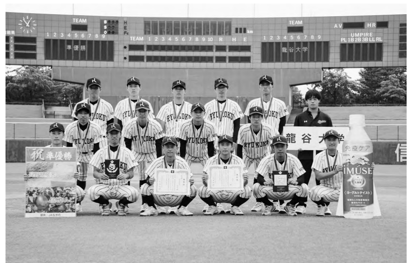
第2回全日本大学軟式野球選抜大会(準優勝)