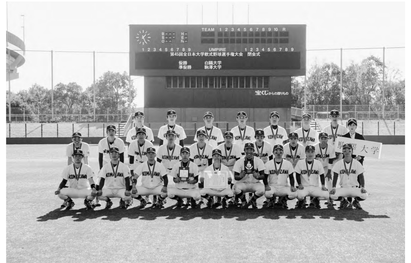
第45回全日本大学軟式野球選手権大会(準優勝)